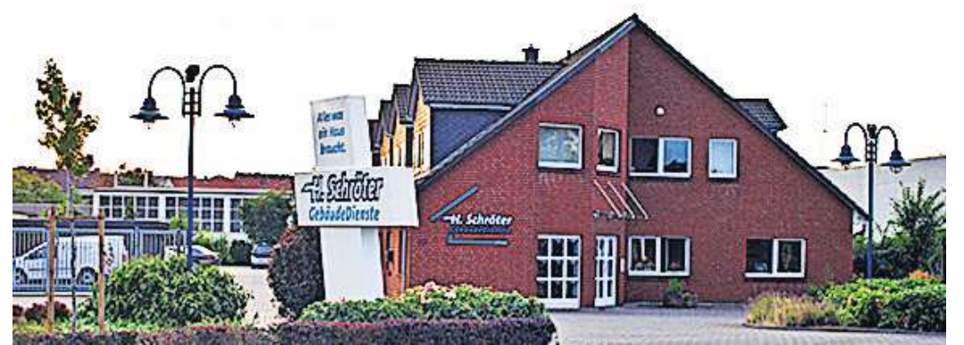
Der Firmensitz in der Münchwiese 22 in Hildesheim.